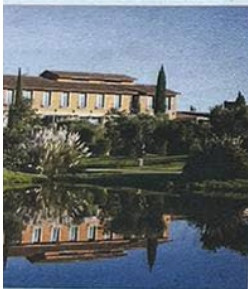
Incluye un campo de golf, un spa y el servicio de 5 estrellas y el wine spa

nueva bodega abre a la sociedad un legado de décadas de dedicación familiar, ligada a un terroir que enamora por su diferencial heterogeneidad y carácter -cercano, elegante y genuino- y que está marcado por su ubicación entre el Pirineo y el Mediterráneo".