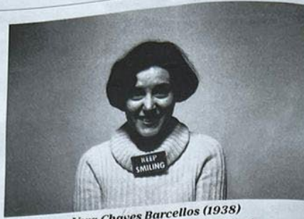
Vera Chaves Barcellos (1938) La artista brasileña expone en Zielinsky

A lo largo de todo el proceso se pone especial atención en el nivel de temperatura y de humedad: desde la cámara que conserva la uva recolectada a mano en las condiciones idóneas tras su entrada en la bodega, hasta el control durante las fases de vinificación, crianza y afinado de los vinos.