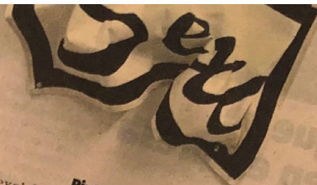
Pinturas fuertes 'Amor, Sexo' del puertorriqueño Quintin Rivera Toro. Sus pinturas fuertes, al arrugarse muestran palabras que evolucionan con los cambios de tiempo

lonés. Con respecto a la ex- periencia, el propio Robert Llimós la explica así: "Una tarde salí a dar un paseo para inspirarme con el paisaje; montículos de dunas hasta el horizonte, aguantadas por cuatro árboles, un cielo nu- blado, un paisaje espectacular lar. De repente, al levantar la mirada, mi sorpresa fue enorme al ver que, medio camuflado por las nubes, se visualizaba un ovni". Las obras recogen esos efectos previos que presencié Llimós -en la abstracción y luces iniciales y en las formas curvilíneas y libres que salían de la nave-, pero también se centra en los personajes que se presentaron al artista en aquella época: una pareja altísima vestida con cuello alto saliendo de la nave.