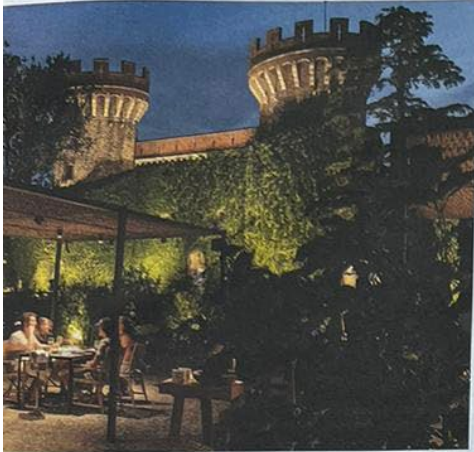
Ello del equipo RCR Arquitectes de Olot, completa la gran bodega rebotante, cuyo símbolo es el castillo del siglo XIV