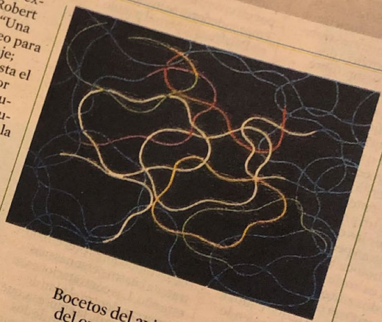
Bocetos del avistamiento del ovni y experiencias anteriores y posteriores centran la muestra